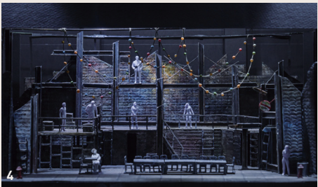
4 뮤지컬 <렌트> 무대모형 Set Design Model of the Musical <Rent>, 2009

무대 뒤 이야기 코너는 세밀하게 제작된 무대 모형, 무대디자인과 공연에 사용되었던 각종 무대 소품이 전시되어 있습니다. “Behind the Stage” exhibits detailed, realistic set design models, design sketches, and various props used in performances.