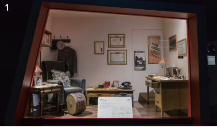
1 연극의 방 Room of Theater

Room of Artists is divided into three sections – Room of Theater, Room of Music, and Room of Dance, each showing the unique features of each genre. Each section has been designed like an artist’s workspace, in which the actual belongings of deceased artists are on display.