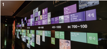
1 공연예술사 연표 Chronological Table of the Performing Arts History

공연예술사 연표를 통해 고대부터 현재까지의 우리나라와 세계 공연예술사의 흐름을 살펴볼 수 있고, 궁중과 민간 전통공연예술의 옛 모습을 애니메이션 영상으로 확인할 수 있습니다. The first section includes a chronological table offering information on the important events in the history of Korean and world performing arts. It also includes an animated video showing examples of traditional performing arts that had been presented at the royal court or in public.