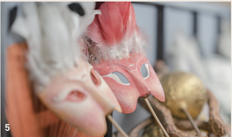
5 국립극장 총제극 <우루왕> 가면 The Masks in <King Uru>, 2001

별별실감극장은 기존의 별오름극장을 개조하여 새롭게 조성 되었습니다. 공연예술 장르와 최신기술이 접목된 영상콘텐츠를 감상할 수 있으며, 공연예술박물관 로비와 상설전시실에서는 증강현실 기술을 적용하여 공연의 주인공이 되어보는 무빙포스터, 무대의상 및 분장, VR 백스테이지 투어 등 다양한 체험을 즐길 수 있습니다.