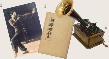
2 조택원 초기 현대무용 사진 Photo of Early Modern Dance by Cho Taekwon, 1930s 3 조선창극사(정노식) History of Changgeuk in Joseon Dynasty(by Jeong Nosik), 1940 4 축음기(Edison Standard B) Phonograph, 1905

개화기부터 근대까지 한국 공연예술이 급격히 변화한 모습을 살펴볼 수 있습니다. The second section includes materials showing how Korean performing arts had drastically changed in the late nineteenth through early twentieth century.