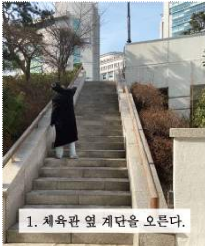
1. 체육관 옆 계단을 오른다.