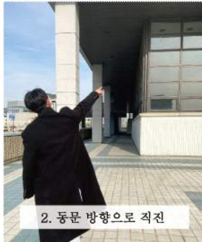
2. 동문 방향으로 직진