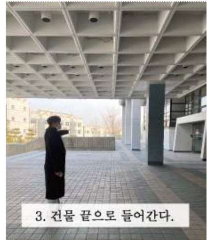
3. 건물 끝으로 들어간다.